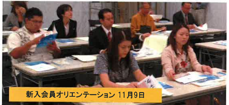
新入会員オリエンテーション 11月9日