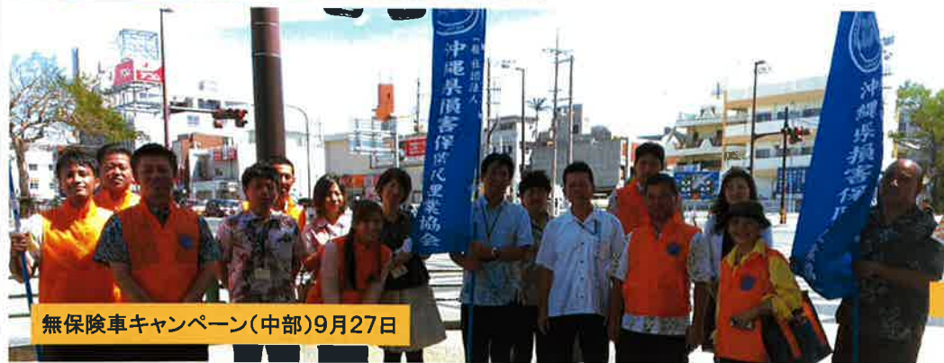
無保険車キャンペーン(中部)9月27日