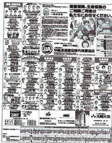
H24・11月30日掲載の広告

「選ばれ続ける保険代理店」として社会に我々の存在をアピールする為にも新聞広告は必要であり、次年度も引き続き取り組みを考えております。ご協力をお願いします。