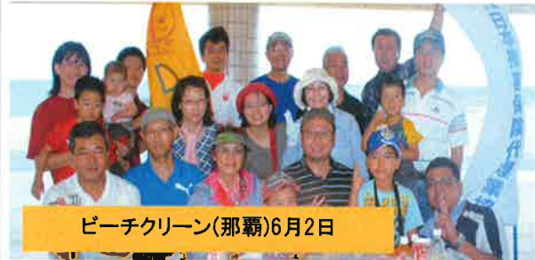
ビーチクリーン(那覇)6月2日