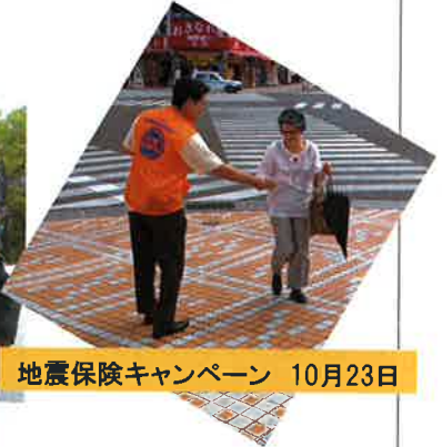
地震保険キャンペーン 10月23日