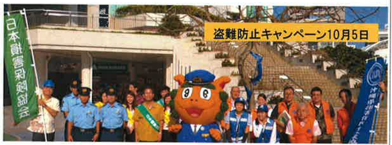
盗難防止キャンペーン10月5日