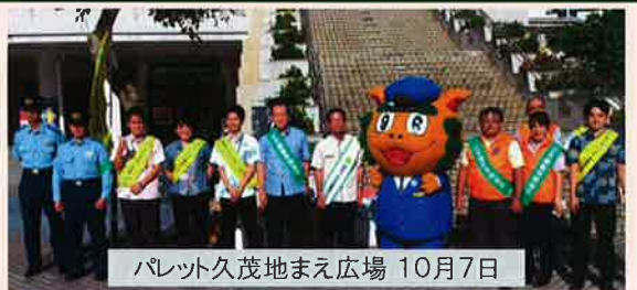
パレット久茂地まえ広場 10月7日

10月7日(盗難防止の日)の全国街頭活動でのキャンペーンは、官民合同プロジェクトの事務局である損保協会からの依頼を受けて行っています。