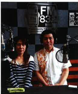
FMとよみ『がんじゅうdeスマイル』の招聘を受け、野原会長と下地副会長が、8月22日(金)午後7時~8時の放送に出演しました!?