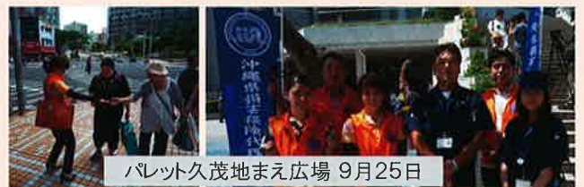
パレット久茂地まえ広場 9月25日