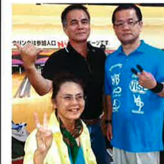
石原プランチーム