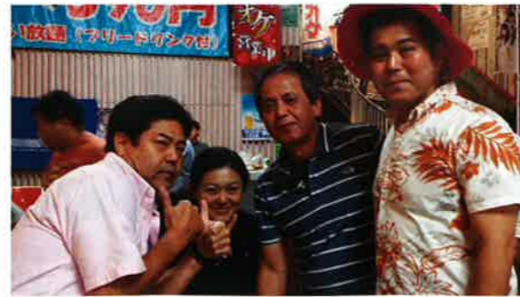
リレーションチーム