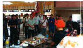
表彰状 差し上げま〜す!!