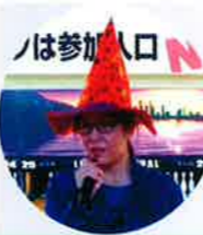
私、へんかしら?(会長)