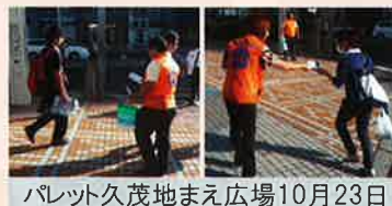
パレット久茂地まえ広場 10月23日